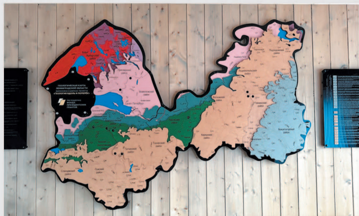
Геологическая карта Ленинградской области

Ленинградская область — в числе лидеров России по развитию особо охраняемых природных территорий и экотроп.