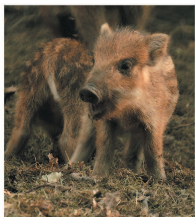
Кабаны — самые плодовитые животные среди копытных

О присутствии этих животных в лесу мы узнаём по участкам земли, которые перепаханы, словно трактором. За день один кабан при помощи своего ловкого и сильного рыла может вспа-