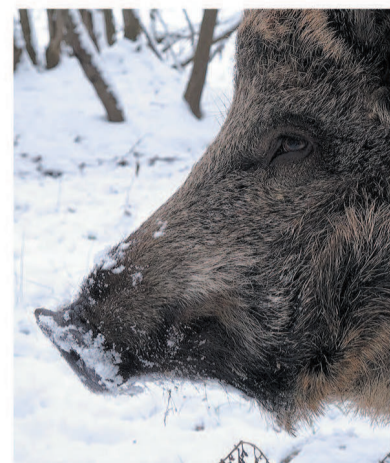
Дикие свиньи живут в Ленобласти с 1947 года