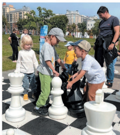
Турнир по гигантским шахматам

Году семье было посвящено и традиционное выступление муниципальных районов и округов Ленобласти. Волховский район предстал перед гостями праздника как большая