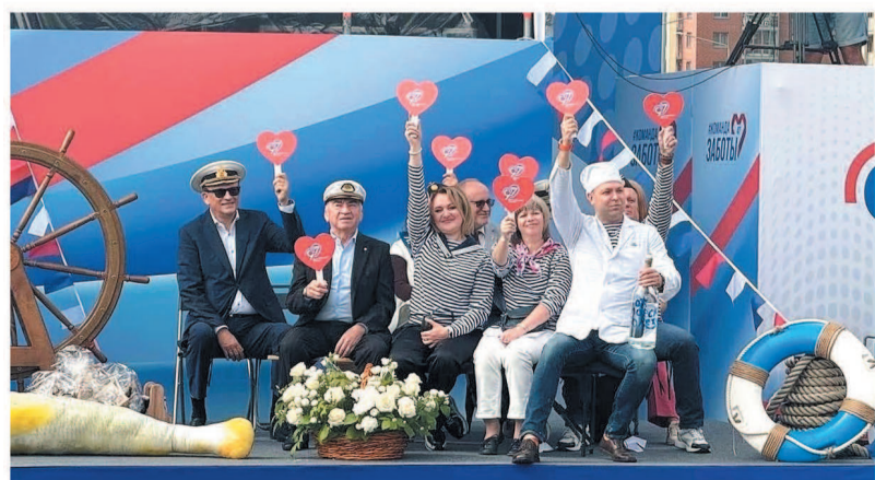
Члены жюри ставили «лайки» выступлению каждого муниципального района и округа