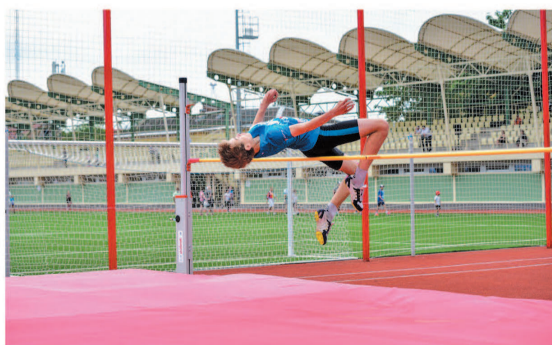
День защиты детей на стадионе «Спартак»

Вопреки антироссийским санкциям в Гатчинском районе