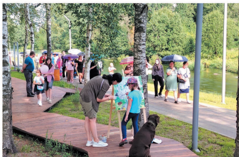
В Гатчинском округе активно идёт благоустройство территорий

СТОЛИЦА ЛЕНОБЛАСТИ ВНОВЬ СТАЛА ПРИМЕРОМ ДЛЯ ДРУГИХ МУНИЦИПАЛЬНЫХ ОБРАЗОВАНИЙ