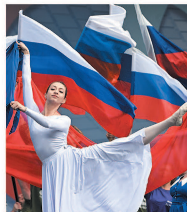
Яркое шоу на сцене парка «Оккервиль»

Совместить развлечения и пользу гостям помогали и представители МЧС России. Они рассказали о современной технике, которая помогает спасать жизни людей: будь то гидравличе-