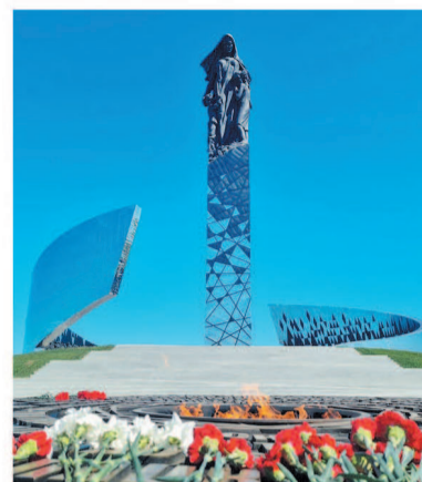
Монумент жертвам геноцида в Зайцево

Сложно представить Гатчину и без богатой культурой жизни. В этом году здесь прошёл юбилейный фестиваль «Литература и кино», недавно отгремели «Пушкинские дни», посвящённые 225-летию со дня рождения великого поэта. Событием всероссийского масштаба стало открытие мемориала памяти жертв