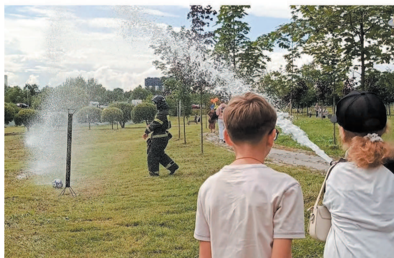
Познавательное развлечение от МЧС: сбивать мишени из пожарного рукава